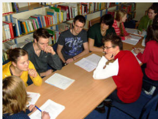
Der Projektkurs "Stätten jüdischen Lebens in Stavenhagen" bei der Arbeit